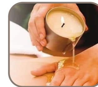
Massage à la Bougie

Evadez vous avec un gommage sur tout le corps pour une peau douce & satinée, suivi d'un modelage doux et relaxant avec une huile délicate au subtil parfum pour vous offrir un moment hors du temps