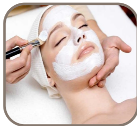
Soins du Visage

Ce soin comprend un démaquillage doux & fruité, un gommage exfoliant, un masque purifiant & un modelage apaisant, hydratant, nourrissant & gourmand pour sublimer votre peau (peut également convenir aux peaux acnéiques)